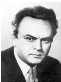
Сергей Федорович Бондарчук 25 сентября 1920 года

Киноактер, драматург. С 1938 по 1941 год Сергей Бондарчук в своей биографии учился в театральном училище Ростова. Когда же началась Великая Отечественная война, образование пришлось прервать. Дебют в кино в биографии Бондарчука состоялся в 1948 году (фильм «Молодая гвардия»). Большой успех пришел к Сергею Бондарчуку после фильма «Тарас Шевченко» (1951). В 1952 году Бондарчук в биографии получил звание Народного артиста СССР. Как режиссер дебютировал в 1959 году, сняв фильм «Судьба человека». Среди известных режиссерских работ Бондарчука: «Война и мир» (4 части), «Ватерлоо», «Они сражались за Родину», «Красные колокола», «Борис Годунов» и многие другие. За всю жизнь Сергей Бондарчук сыграл более чем в 30 фильмах