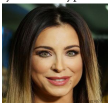
Ани Лорак (Каролина Мирославовна Куек) 27 Сентября 1978 года

известный российский ученый-физиолог, лауреат Нобелевской премии. Является автором учения о высшей нервной деятельности и физиологии пищеварения, основателем самой крупной физиологической школы в России. Его труды внесли неоценимый вклад в развитие медицины, психологии и физиологии. За успешные труды в области физиологии пищеварения Павлов получает Нобелевскую премию в 1904 году. Он стал самым первым российским ученым-лауреатом этой премии.